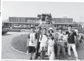
▶ヒロシマ 嵐の中の母子像前にて 後ろは平和記念資料館