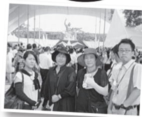
▲ナガサキ 祈念式典にて