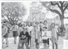
▲ヒロシマ 後ろは原爆ドーム