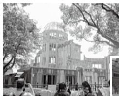
▲ヒロシマ 原爆ドーム