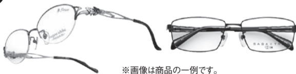
※画像は商品の一例です。

お近くの「眼鏡市場」店頭で組合員証を提示すると、 メガネ一式・コンタクトレンズが店頭価格より