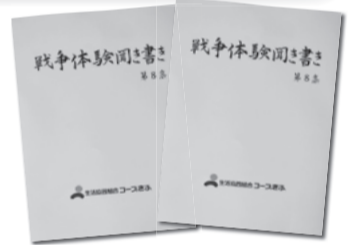
毎年県内図書館に100冊寄贈しています

■応募先 〒509-0197 岐阜県各務原市鵜沼各務原町1丁目4番地1 生活協同組合コープぎふ 「戦争体験聞き書き」作文募集係 メールの場合は、下記のアドレスへ E-mail ttakahas@tcoop.or.jp