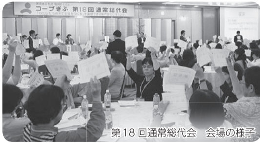
第18回通常総代会 会場の様子