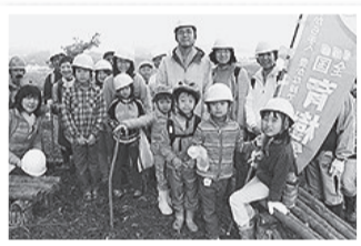
コープぎふの森山頂にて

災害時・アウトドアに役立つ「湯煎でできるポリ袋調理」を紹介し、試食 します。サツマイモごはんや鮭わかめごはんを予定しています。