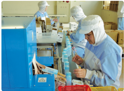
ひとつひとつチェックして