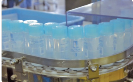
ボトルにつめられたスキンローション