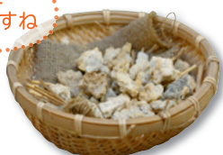
結晶はかすかにイオウの香りがしますね

天然湯の花は、別府温泉の地中から吹き出す温泉ガスが結晶化したもの。それを濃縮し、イオウを除いたエキスを使用します。