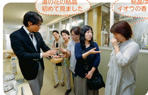
湯の花の結晶 初めて見ました

ミキサーで原料を混ぜ合わせ、反応を促進。その後、時間と温度を調整して品質を安定させる「熟成」を経て入浴剤になります。