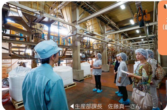
長森レンゲクラブ (岐阜南支所エリア) の組合員さんが工場を見学