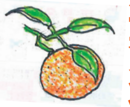
イラスト 岐阜市 まりちゃん