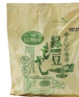
緑豆もやし 200g 本体価格46円 税込価格49円 企画予定▶毎週