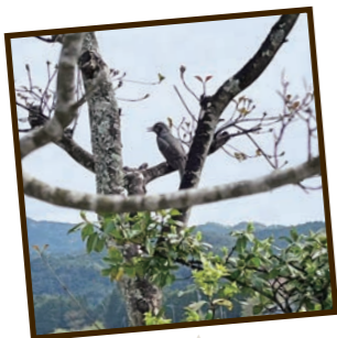
5月の写真ですが、ヒヨドリが毎日この木に止まり遠くを眺めていました。(中津川市 くーちゃんさん)

小学校5年生の息子の運動会。やっと制限なしで祖父や祖母はじめ、家族全員で楽しめました。マスクなしの子ども達の応援はとても元気で、見ている方も気持ちが良く、いい運動会でした。(高山市 モーモーアサヒさん)