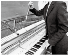
※調律作業のイメージです。

乾燥剤 (別料金) は2個セット3,000円 (税込3,240円) 必要に応じてお申し込みいただけます。