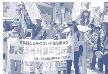
昨年の岐阜市内ピースウォークより