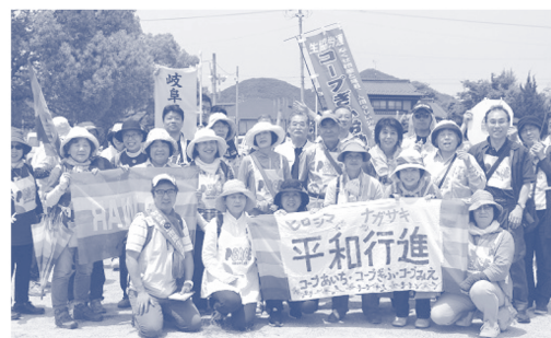
2017年 愛知・岐阜の引継ぎ集会の様子 集会後、各務原市民公園周辺をピースウォーク