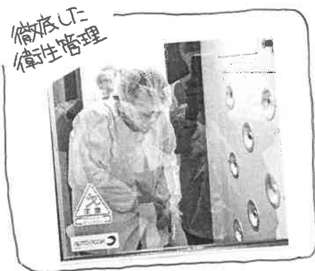
徹底した衛生管理