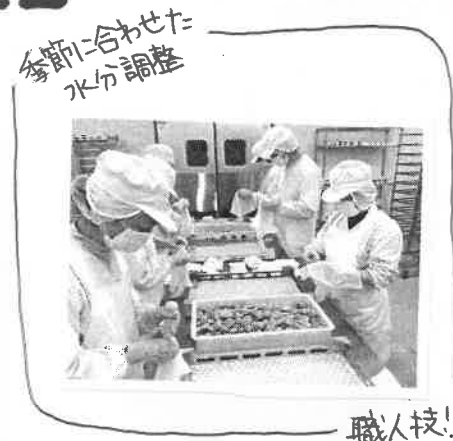
季節に合わせて水分調整